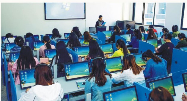
英语教育专业学生口语实训