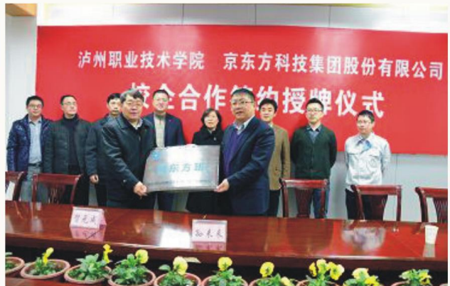
学校与京东方科技集团校企合作签约授牌仪式

计与组装工艺、通信网络综合布线、计算机网络与数据库、智能终端产品维修、通信工程传输与接入、高频电子技术等。