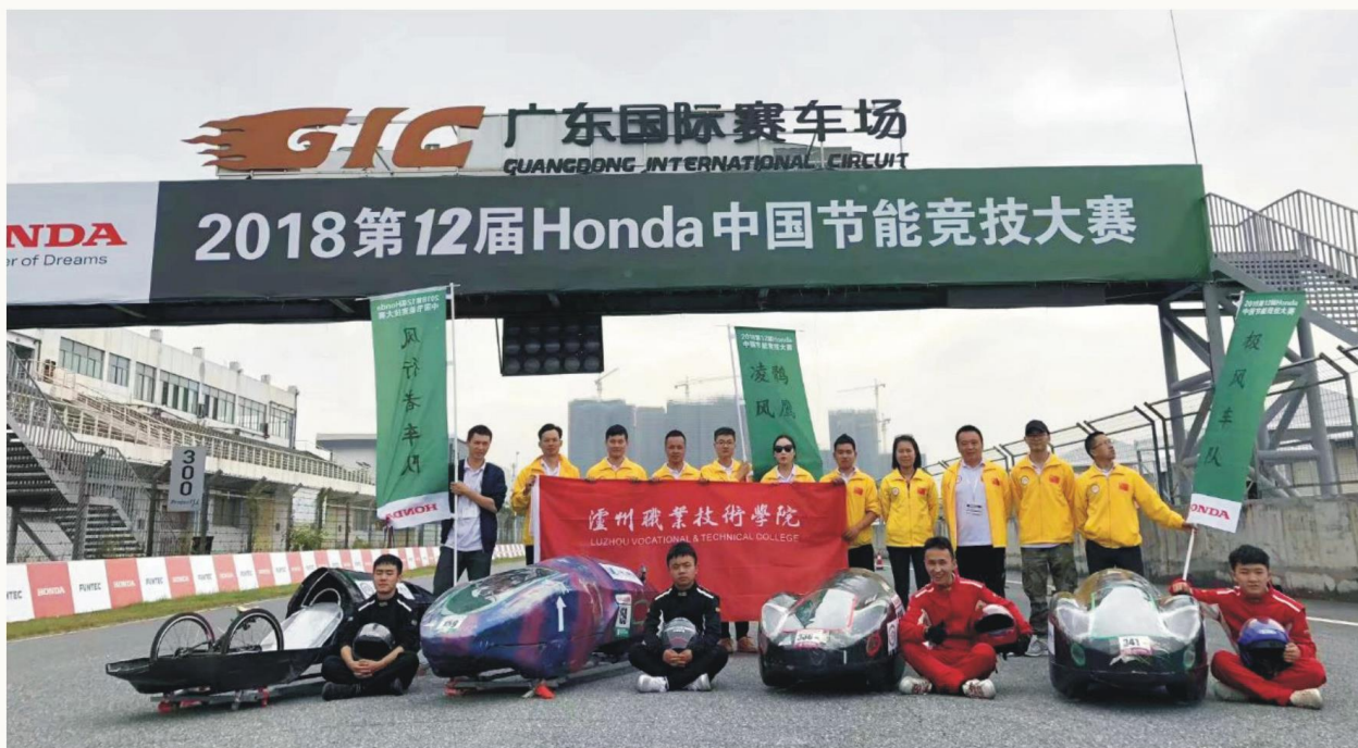
学生车队参加第十二届全国节能车大赛获高职高专组第二、第三名

费 4850 元/年。2011 年列为中央财政支持建设专业，2016 年被教育部列入“中德诺浩高技能汽车人才培养助推计划”项目。学生历年参加“Honda 中国节能竞技大赛”和四川省教育厅、人社厅组织的各类比赛且成绩优异。学生在取得学历证书的同时，也可通过考试获得汽车维修工高级工等国家职业资格证书。以专升本和专套本项目保障学历晋升。