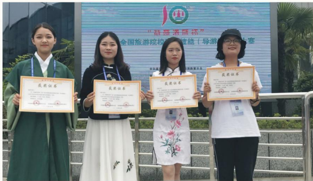
旅游管理专业学生在全国旅游院校导游技能大赛中荣获二、三等奖

培养目标 培养具有国际旅游发展视野，掌握现代旅游企业经营管理的理论知识，熟练掌握国际旅行社（含出境社）主要业务知识与实践技能，能适应国内和国际旅游企