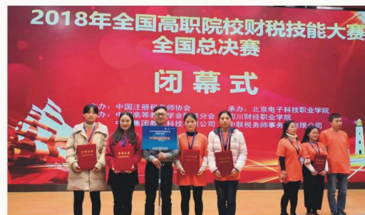
2018年全国高职院校 财税技能大赛全国总决赛三等奖