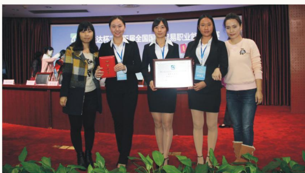
第五届全国国际贸易职业竞赛荣获全国二等奖

就业方向 毕业生可在中外企业、政府机关、事业单位从事商务翻译、外贸业务、行政管理等工作，也可在国外高薪就业。