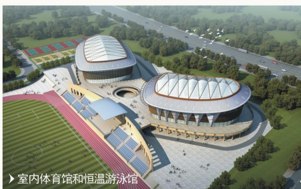
▶ 室内体育馆和恒温游泳馆