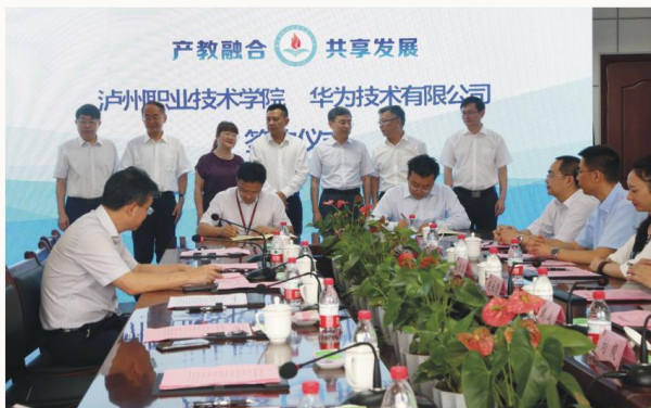
华为 ICT 学院西南培训基地签约仪式