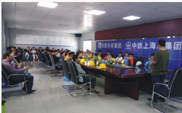
学生赴中铁上海局集团实习