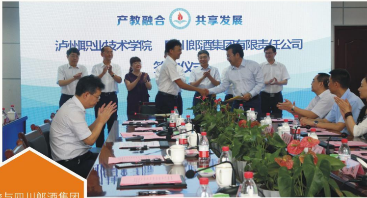
学校与四川郎酒集团 有限责任公司 合作共建郎酒学院