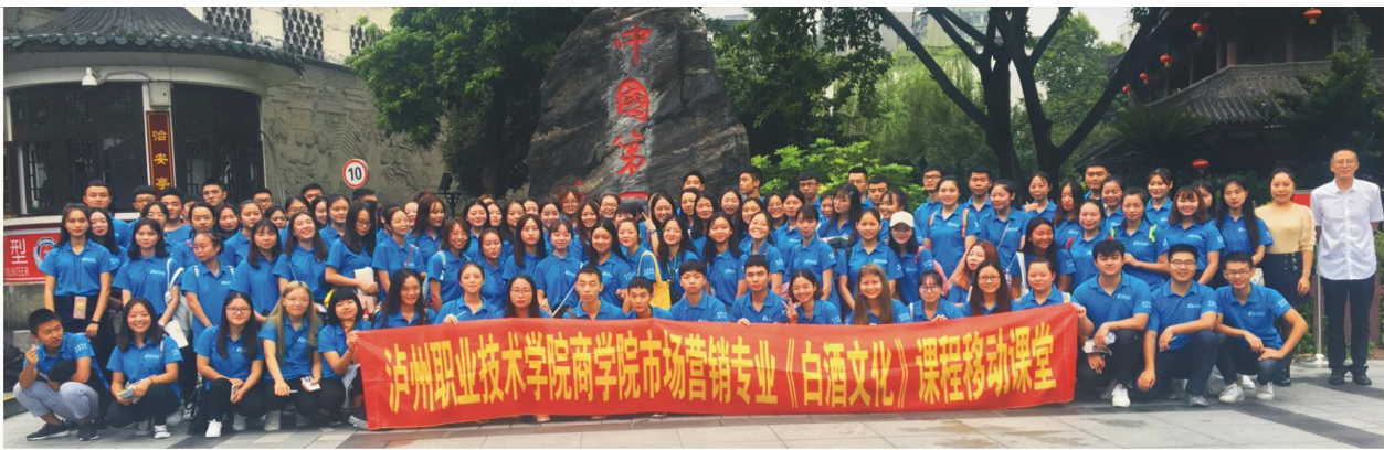
市场营销专业《白酒文化》课程移动课堂