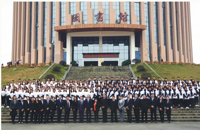
洲际英才班和智选总经理班合影