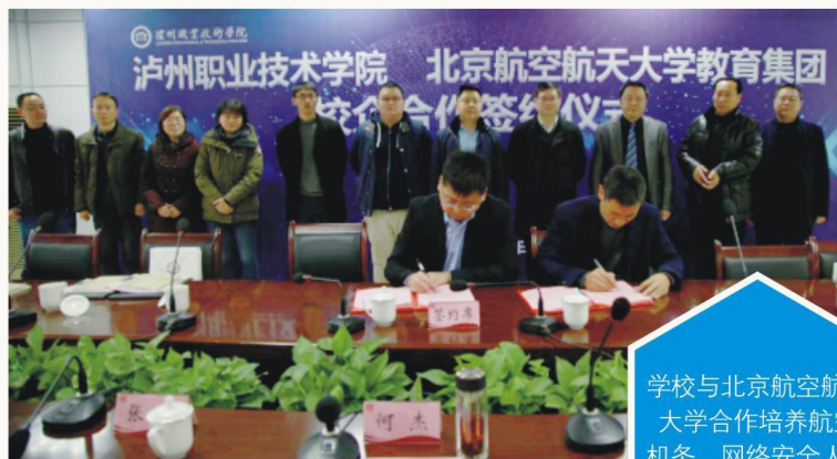
学校与北京航空航天 大学合作培养航空 机务、网络安全人才