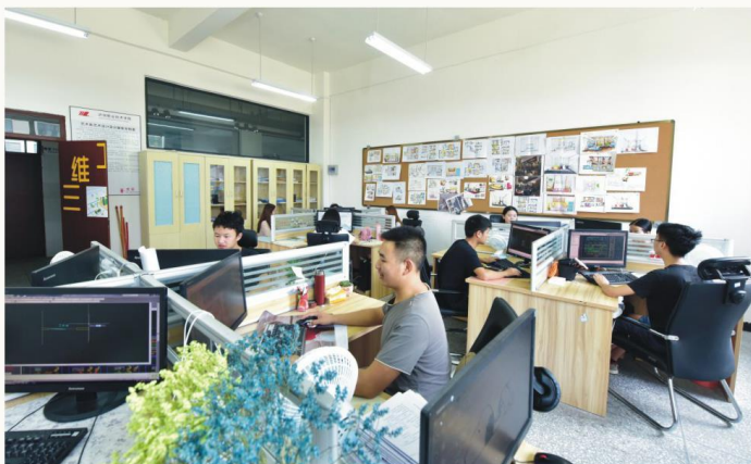
环境艺术设计工作室