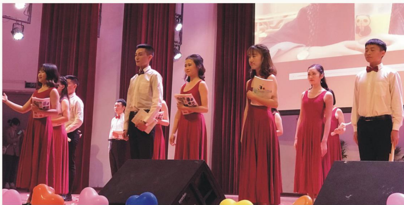
师范类专业技能展示

主干课程 小学语文教学法、现代汉语、基础写作、中国古代文学、中国现当代文学、教育心理学、教育学、儿童文学、外国文学、古代汉语、普通话、三笔字、教师口语与礼仪等。