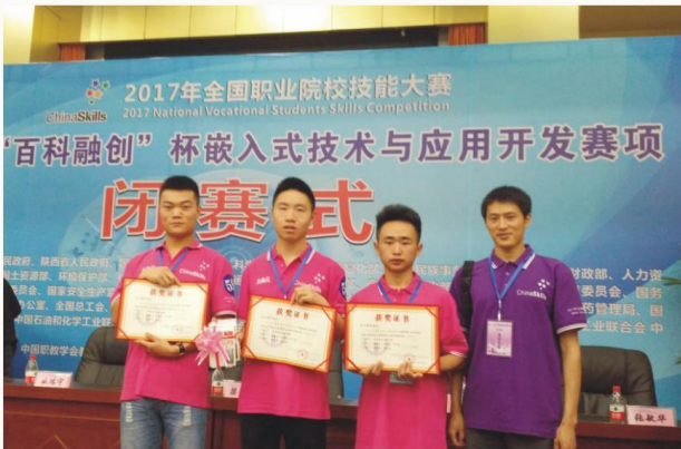
2017年全国职业院校技能大赛嵌入式技能竞赛获全国三等奖