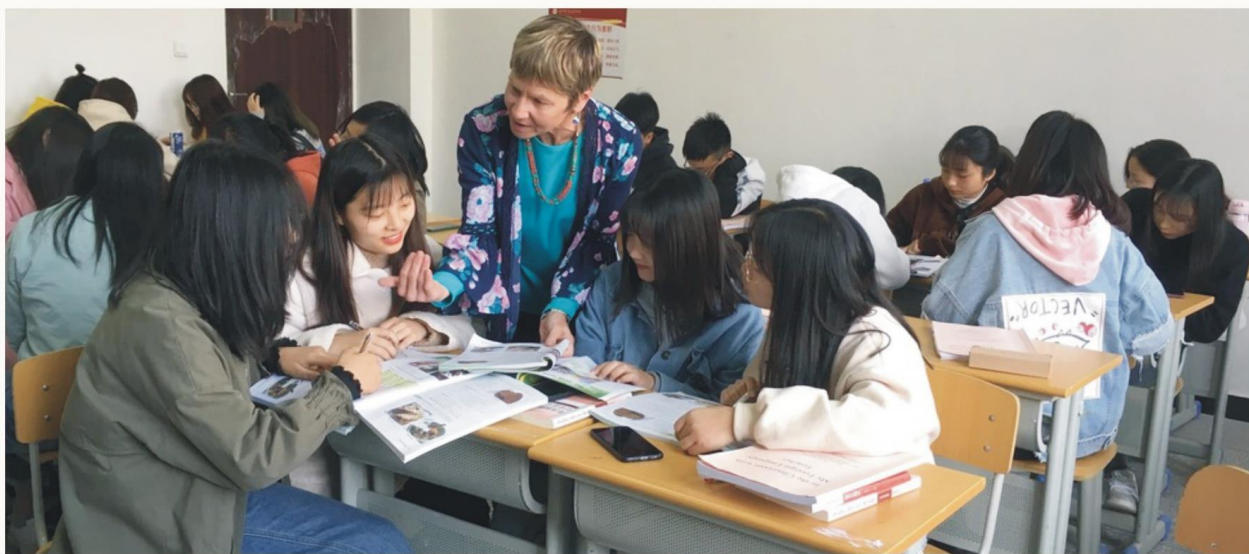
外教英语口语分组教学