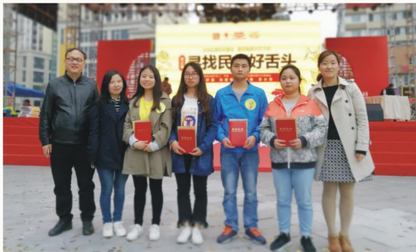
酿酒技术专业学生在全国民间好舌头品酒大赛中荣获“全国十佳”

专业特色 本专业“因企业需求而设立，因服务社会而发展”，遵循“校企合作、工学结合、理实一体”的指导思想，是教育部第三批“现代学徒制”改革试点专业和四川省