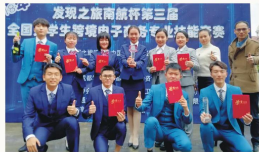
2018年发现之旅南航杯第三届 全国大学生跨境电子商务专业技能竞赛二等奖