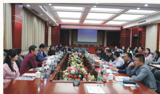
校企合作共建保税物流专业研讨会