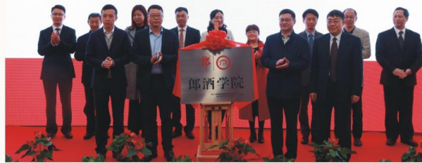
郎酒学院揭牌仪式