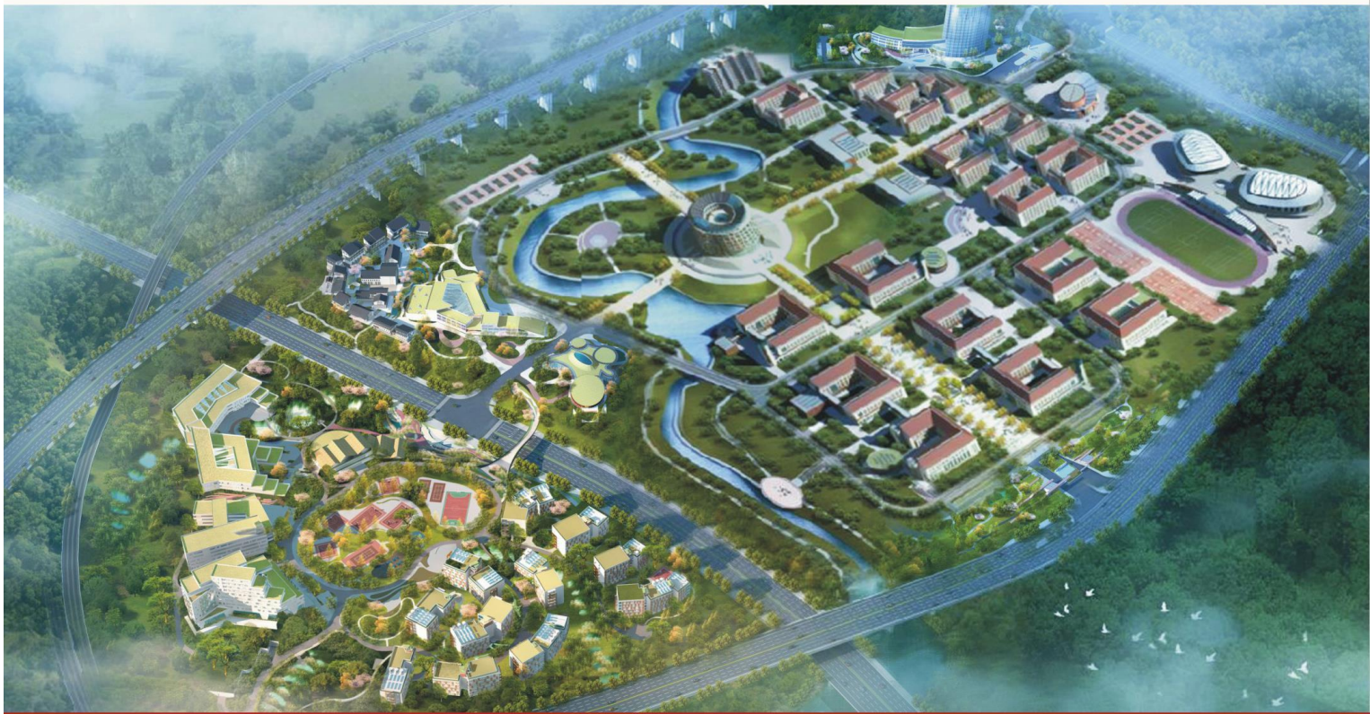
学校平面设计鸟瞰图