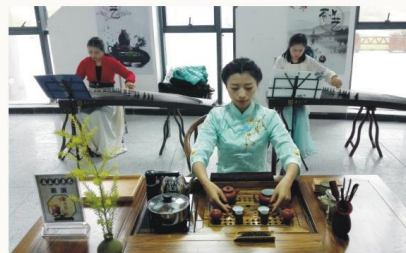
第三届中国青年技能营茶艺表演

省级“现代学徒制”改革试点专业。与郎酒集团共建郎酒学院、四川省工程技术研究中心；与泸州老窖共建四川省白酒酿造技术产业研究院。与郎酒集团、川酒集团等大型酒企建立订单班，采用“现代学徒制”教学模式，实施订单式培养，实现招生、招工一体，实现与白酒企业资深酿酒大师、品酒大师及检测人员紧密互动，共同培养高技能人才。学生在校可考取品酒师、酿酒师、农产品食品检验员等职业资格证书。