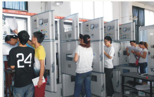
电力系统自动化技术专业实训

就业方向 楼宇智能化工程设计、安装调试、运行管理；电梯类特种设备工程技术及项目管理。