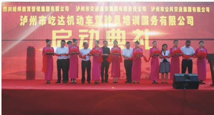
学校与泸州市交投集团、泸州市公交公司合作共建吃达驾校

学校坚持“产教融合、校企合作”办学，积极创新办学体制机制，形成了“1+1+1”专业建设模式，即1个专业对接1所本科院校和1个上市企业或知名企业合作办学，提高人才培养质量。