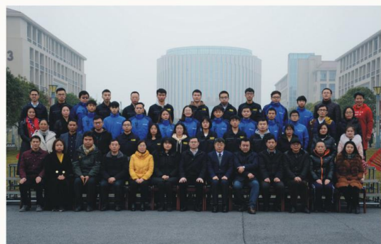
奥的斯OTIS电梯订单班同学合影