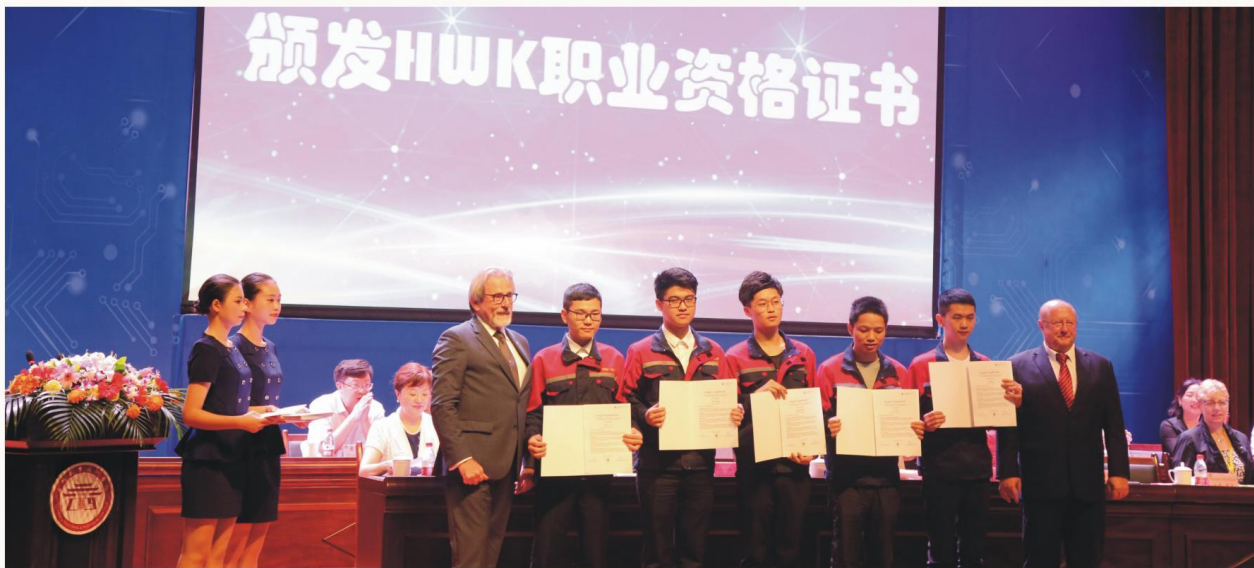
德累斯顿HWK代表为我院中德班同学颁发HWK职业资格证书