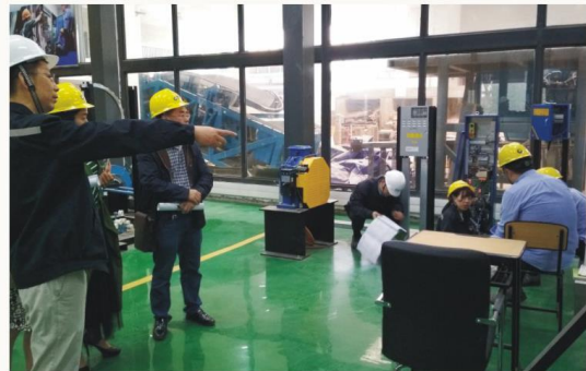
奥的斯OTIS电梯实训现场