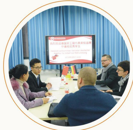
德国劳工局代表面试 我校中德班学生