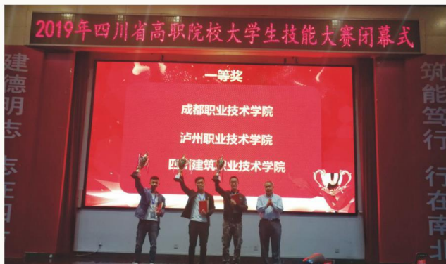
我校学生获四川省高职院校大学生技能大赛一等奖