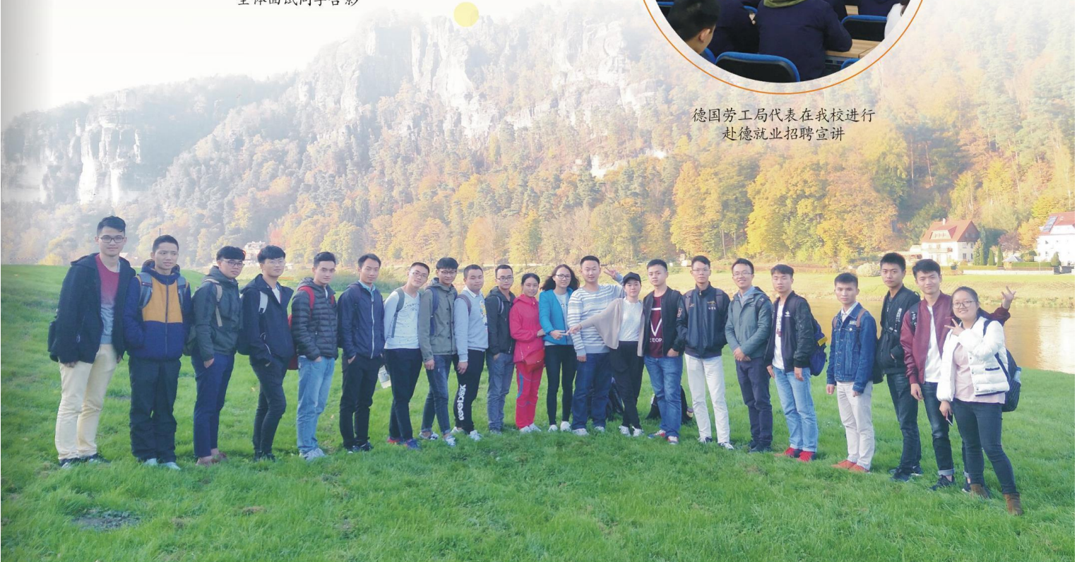
中德班同学赴德国学习之余周末郊区集体活动