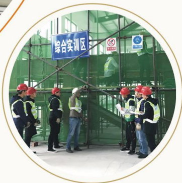
主体工程施工实训