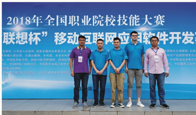
2018年全国职业院校技能大赛移动应用软件开发赛项三等奖

主干课程 网络技术、数据库技术、网络设备互联技术、服务器技术、网络安全技术、系统集成技术、网页设计与网站运营、PHP面向对象编程技术、互联网应用项目开发、高级商务办公等。