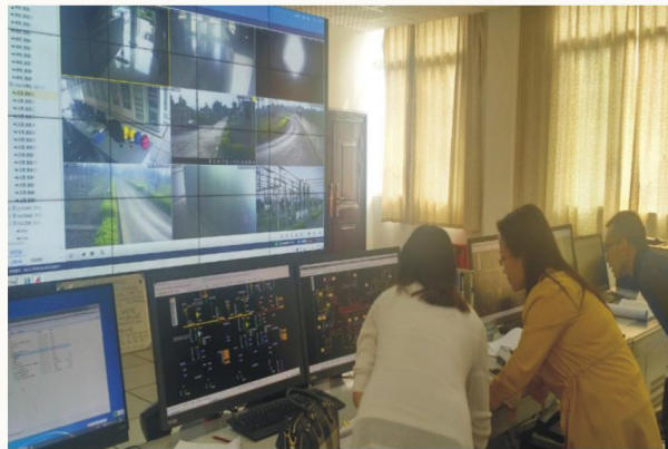
学生在电力调度中心实习