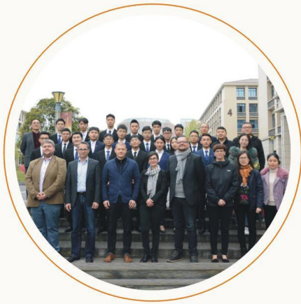
德国劳工局代表与 全体面试同学合影

学校以开放的视野着力探索国际交流与合作，与英国伯明翰城市大学、德国德累斯顿工业大学、中国南非交流中心、德国HWK协会等合作开展学术交流与科研、专业建设、师资培训、留学生培养、HWK职业资格培训、考证与赴德就业等项目，提升国际交流与合作办学水平。