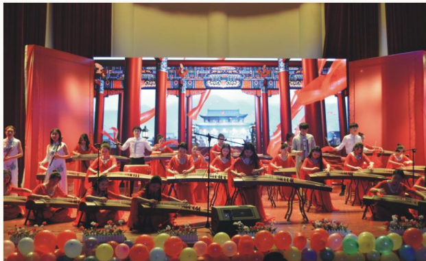
音乐教育专业毕业汇演

就业方向 毕业生可在动画、广告、摄影、传媒、商贸、房地产等行业从事广告设计、网站美工、摄影摄像、影视后期、角色设计、动画设计与制作、UI/UE设计、VR漫游动画、VR全景图制作等工作。