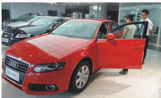
汽车电子技术教学

就业方向 毕业生能在汽车行业从事汽车网络化控制技术、智能车辆控制技术等领域的测试、维护维修、制造及售后服务、汽车电器改装等工作，同时也可胜任高级技术管理工作。