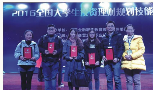
2016年全国大学生 投资理财规划技能大赛二等奖