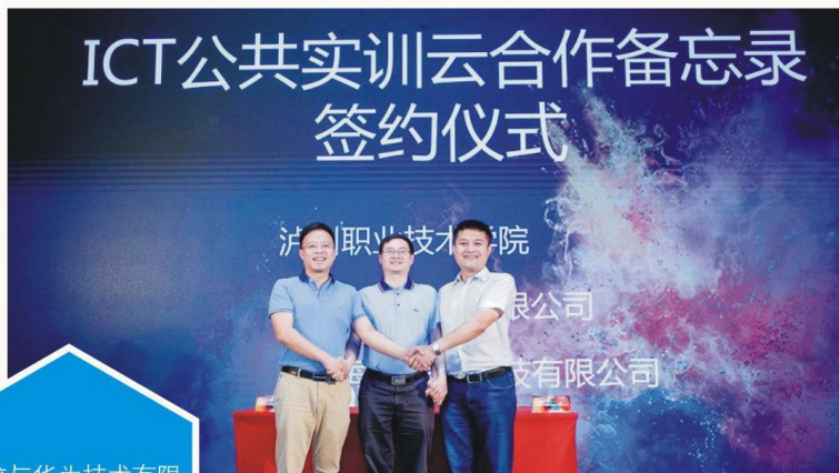
学校与华为技术有限 公司合作共建ICT学院