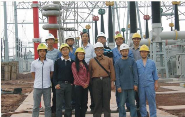
电力专业校外实训基地