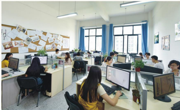
虚拟空间设计实训