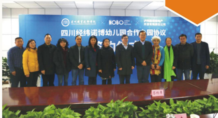
学校与诺博集团 共建高端幼儿园