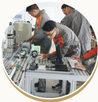
视觉传感系统实训