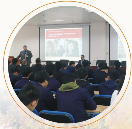
德国劳工局代表在我校进行 赴德就业招聘宣讲