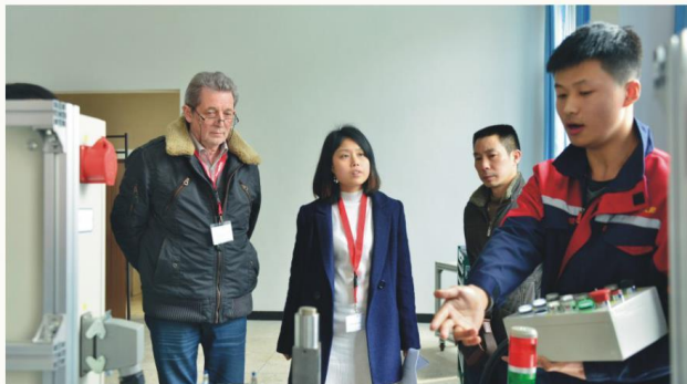
中德机电一体化师考试

就业方向 毕业生可在机械、电子、航空、航天等行业从事机电一体化产品设计与制造、安装调试、操作运行、维护维修、生产管理及机电产品营销等工作。