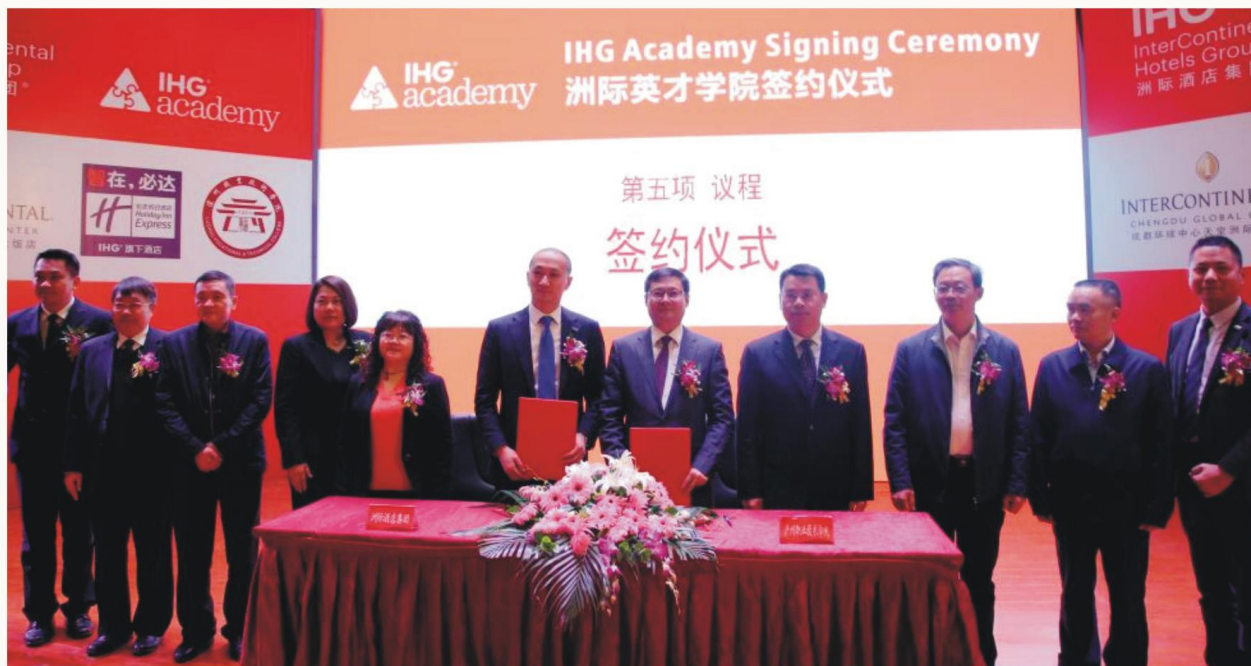
学校与洲际酒店集团合作共建英才学院

学校坚持毕业生高质量就业，与四川郎酒集团、绿地集团、川酒集团、京东方科技股份有限公司、富士康科技集团、洲际酒店集团等10余家企业开设订单班或人才定向培养；与中交集团、中建集团、核工业华东建设集团、泸州老窖集团、华为技术有限公司、中兴通信股份有限公司、吉利汽车集团、海尔集团、诺博集团、成都金苹果教育集团等300余家知名企业或上市企业开展就业合作，实现学生出国就业达到10%，高端就业达到50%，毕业生就业率连续9年保持在97%以上。